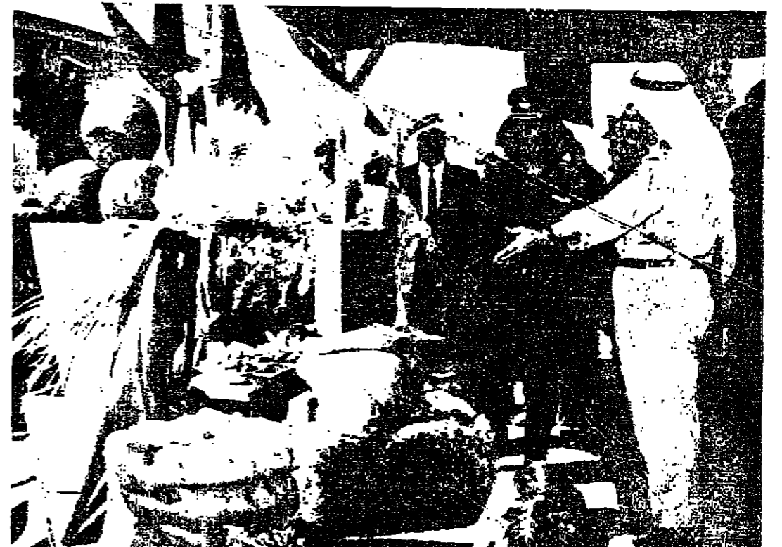
جلالة الحسين يستمع من السيد سامي ابوب وزير الزراعة الى شرح عن الانتاج الزراعي في الاراضي المنصرفة في الجفر ( تصوير ١٠.١ )